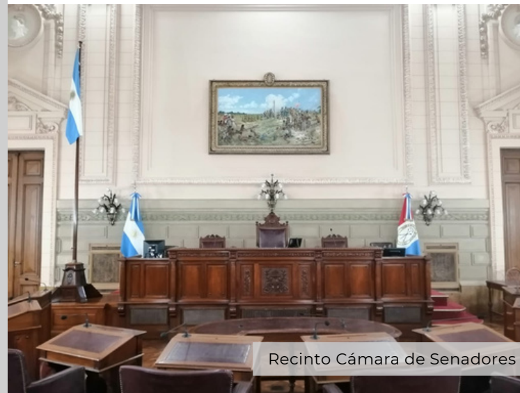
Recinto Cámara de Senadores

La Cámara de Senadores es presidida por el/la Vicegobernador/a y, en caso de ausencia, por un/a Presidente/a Provisional que se elige anualmente de su seno. Durante las sesiones, el/la Vicegobernador/a solo tiene voto en caso de empate.